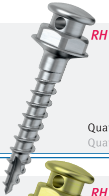
Quattro RH micro pro Quattro RH micro pro