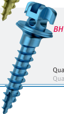
Quattro BH mini plus Quattro BH mini plus